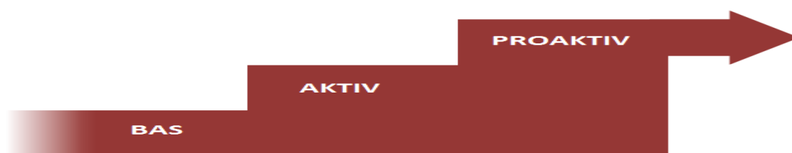
Figur 1. Projektet ”Bygga med BASTA”s fördefinierade målnivåer presenterade som trappstegsmodell.

Projektet ”Bygga med BASTA” har fördefinierat tre målnivåer för en rad områden, såväl organisatoriska som projektspecifika. De tre målnivåerna motsvarar tre steg i en trappa; Bas, Aktiv och Proaktiv, se Figur 1.