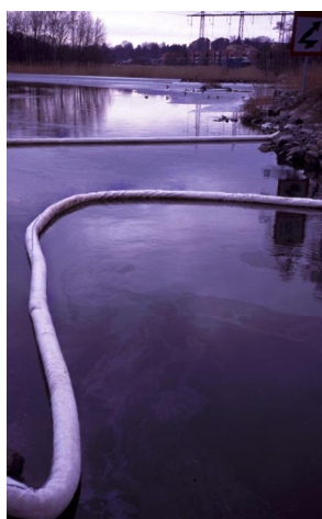
Absorbentlänna för upptag av dieselutsläpp