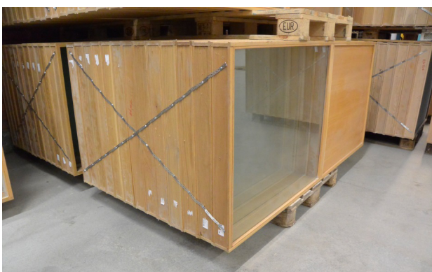
Figur 3. Säkring ("kryssning") av glaspartier med hjälp av hårt spänt montageband.