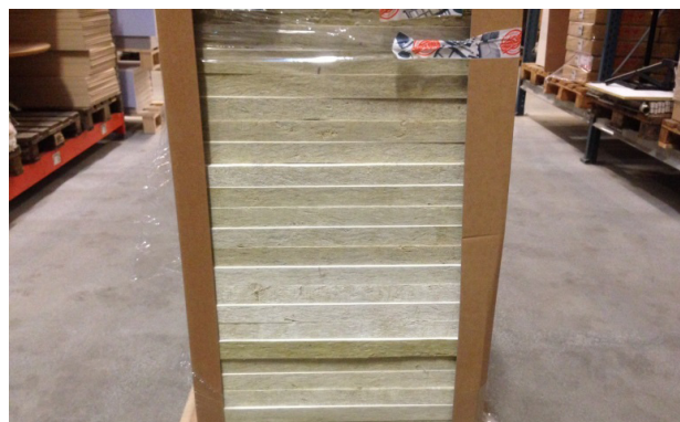
Figur 6. Stapling och stabilisering av akustikplattor.