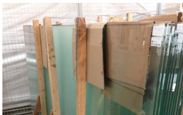
Figur 4. Säkring av glaspartier med hjälp av träreglar. Viktigt med wellpapp mellan varje glasskiva som hindrar repskador och liknande.