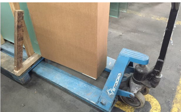
Figur 5. Skydd av utstickande delar med wellpapp eller liknande.