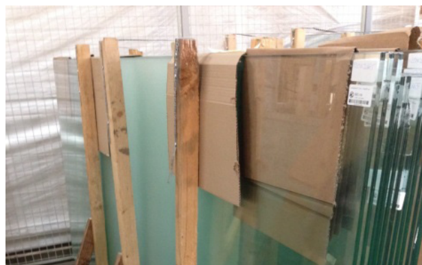
Figur 4. Säkring av glaspartier med hjälp av träreglar. Viktigt med wellpapp mellan varje glasskiva eller hindrar repskador och liknande.