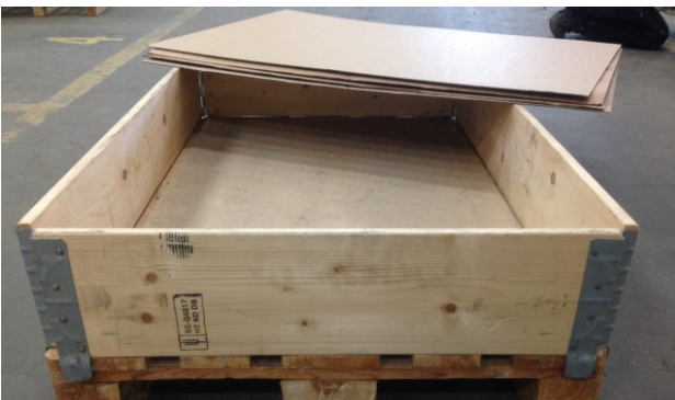
Figur 4. Pallkragar för att kunna stapla flera lager ovanpå varandra.