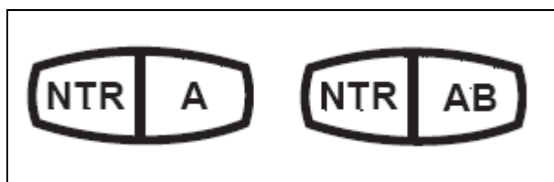
Figur 1 De vanligaste märkningarna NTR A och NTR AB innebär att virket kan användas i kontakt med mark och sötvatten respektive ovan mark.

Impregnerat trä enligt dessa träskyddsklasser är producerade enligt gemensamma nordiska regler som utarbetats av NTR och som baseras på europeiska standarder. I Sverige har SP Sveriges Tekniska Forskningsinstitut ansvaret för kvalitetskontroll och certifiering av impregnerat trä som produceras enligt NTR regelverk. Företag som producerar kvalitetskontrollerat, impregnerat trä får märka sitt virke med det s.k. NTR-märket (se Figur 1), som också visar till vilka huvudsakliga användningsområden virket kan brukas.